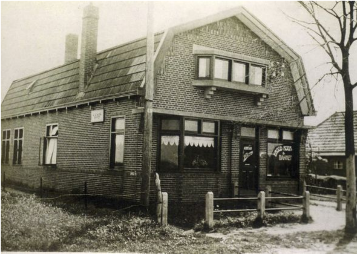
Mijn geboortehuis, bakkerij J.Eising Eerste Exloërmond